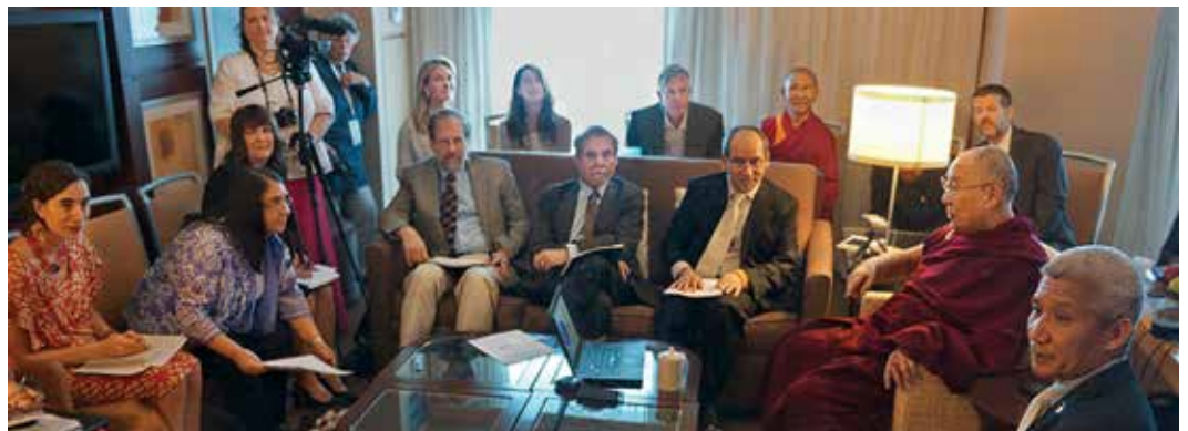
Rencontre de Sa Sainteté le Dalaï-Lama avec des pédagogues, des chercheurs spécialistes de l'éducation, lors de la réunion du programme d'Apprentissage SEE en juin 2016

L'APPRENTISSAGE SOCIAL, ÉMOTIONNEL ET ÉTHIQUE (OU APPRENTISSAGE SEE) est un nouveau programme d'éducation internationale élaboré à l'université Emory qui a pour but fondamental de développer « un monde compassionnel et éthique pour tous.